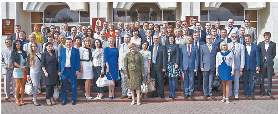
В 2014 году конференция уполномоченных по защите прав предпринимателей собрала в Ярославле более 100 участников из 52 регионов России

При этом предприниматели возмущены еще и тем, что требований со стороны проверяющих органов стало настолько много, что знать их все становится просто невозможно. Данные