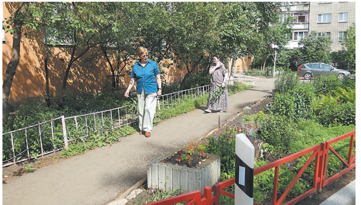
Во дворе, где нет доступа вандалам, идеальный порядок и уют

От редакции. Несанкционированные надписи и рисунки на стенах МКД, заборах, гаражах и транспортных средствах – проблема всего Ярославля. Решать ее надо комплексно. В приемной партии «Единая Россия» 29 июля в рамках комиссии по работе с обращениями граждан соберутся депутаты областной Думы, муниципалитета, представители исполнительной власти, правоохранительных органов, УК, председатели ТСЖ, профессионалы-граффитчики для поиска путей решения этого большого вопроса.