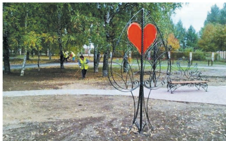
Управдом Заволжского района помог оборудовать сквер в проезде Доброхотова