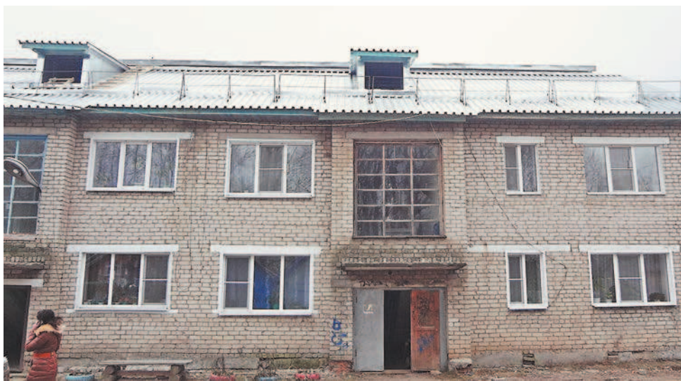
Новая крыша дома 9 б по ул. Вологодской в Данилово

Р.С. График приемки домов, годовые планы ремонтов размещаются на сайте фонда: www.yarmkd76.ru