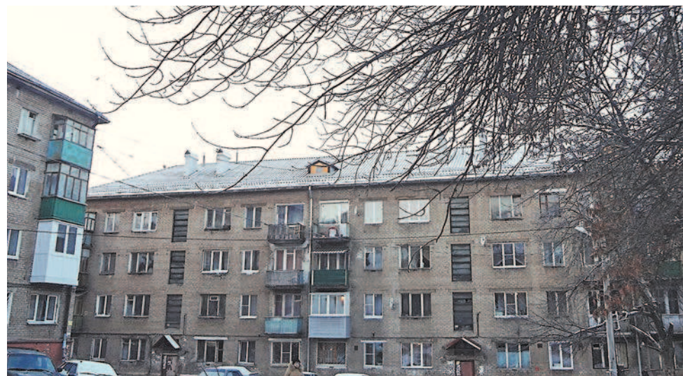
Новая крыша дома 7 по ул. Зелинского в Ярославле

С 1 июля собственники платят ежемесячные взносы на капремонт. Отмечу хороший уровень собираемости платежей: за прошедший период – с июля по ноябрь – данный показатель по области составил