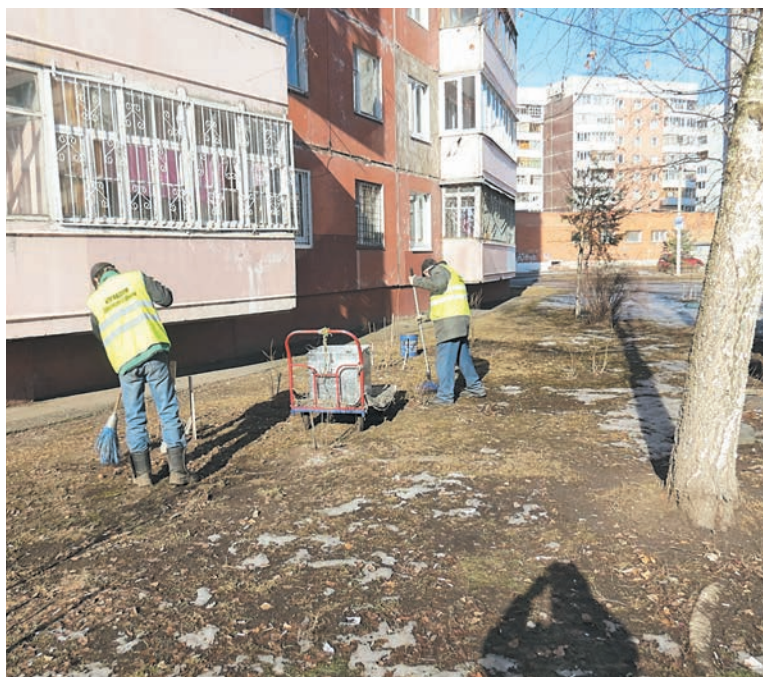
На газоне у дома еще не полностью сошел снег, но весь мусор уже убран. За работой дворники производственного участка № 2