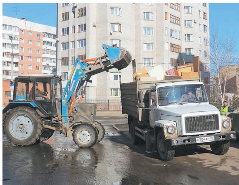
Крупногабаритный мусор с контейнерной площадки уже погружен в машину. Но в кузове еще есть место. Через секунду из тракторного ковша туда загрузят сор, собранный дворниками во дворе

В марте 2015 года Заволжский район занял 2 место по итогам ежегодного городского конкурса «Лучшая организация работ по обращению с твердыми бытовыми отходами в Ярославле». Поздравляем!