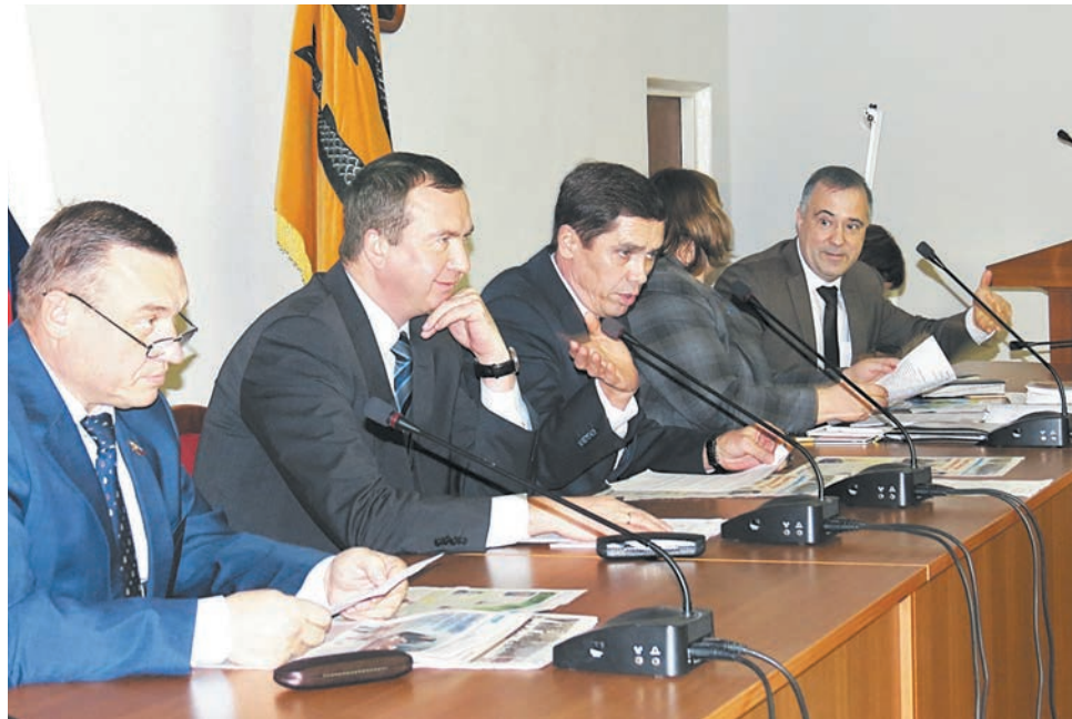
На заседании АСЖ «Ярославия» проблемы жителей многоквартирных домов решают совместно: ресурсники, депутаты, Фонд капремонта, общественный контроль в сфере ЖКХ

– К сожалению, мы так и не смогли организовать совещание в Угличе. Позиция главы района была категоричной, он посчитал невозможным провести собрание до тех пор, пока у него не будут улажены вопросы, связанные с Региональным фондом содействия капитальному ремонту многоквартирных домов Ярославской области, а именно с теми проблемами, которые возникли по итогам капитального ремонта МКД осенью прошлого года. Я его позицию поддерживал. Но тянуть дальше тоже нельзя. Проблемы есть, их надо обсуждать, а самое главное, немедленно приступать к их устраниванию.