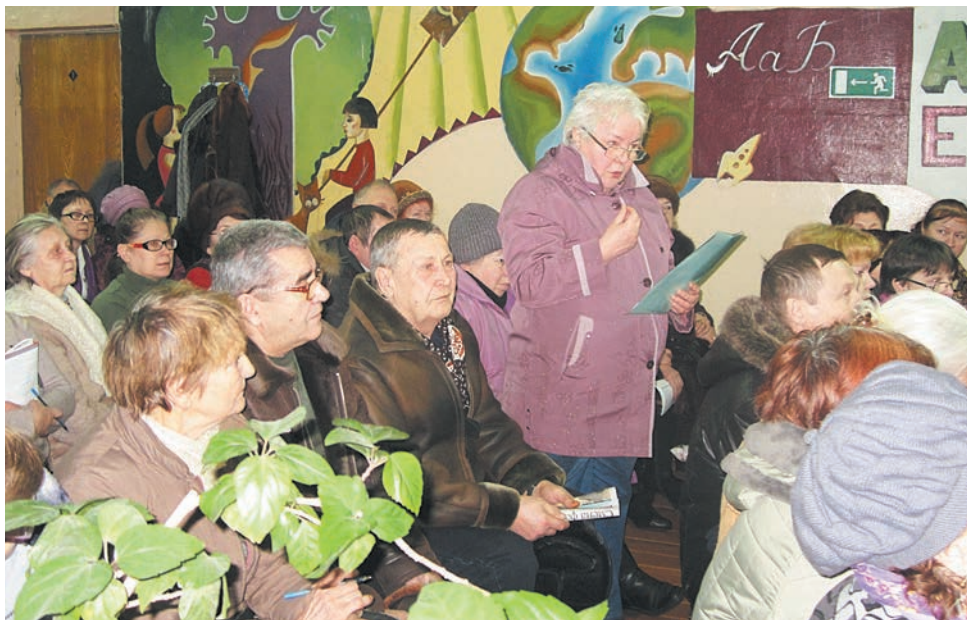
В Рыбинске проблем у собственников жилья множество. На встрече с АСЖ «Ярославия» яблоку негде было упасть

– В этом состоит цель вашей работы, вашего сотрудничества с муниципальными