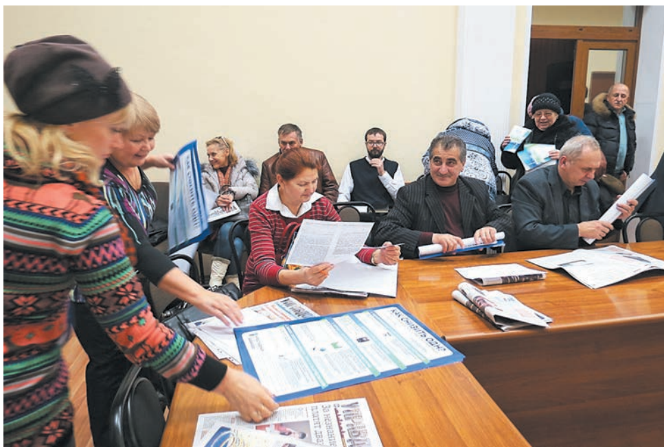
В Переславле основные вопросы: капремонт и ОДН – те, что касаются каждого жителя без исключений