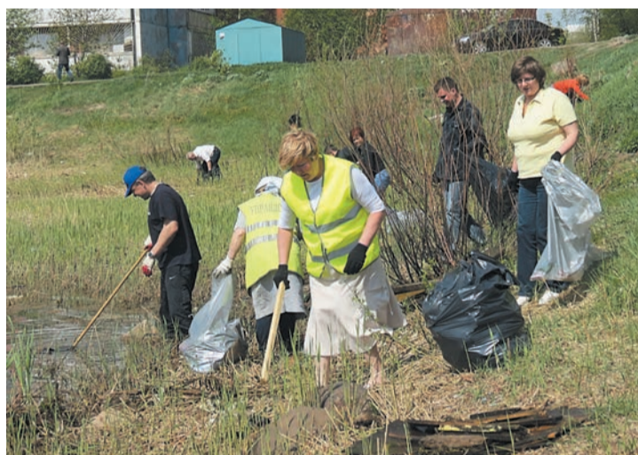
Приняли участие в очистке пруда и некоторые работники Управдома Заволжского района. Не по долгу службы!

На организованный Управдомом Заволжского района субботник вышли жители окрестных домов