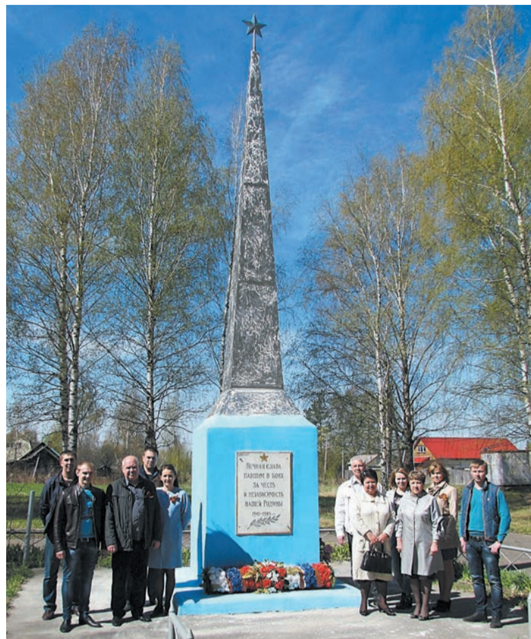
Представители Управдома Заволжского района возлагают цветы к обелиску на 3-й Сергейцевской улице