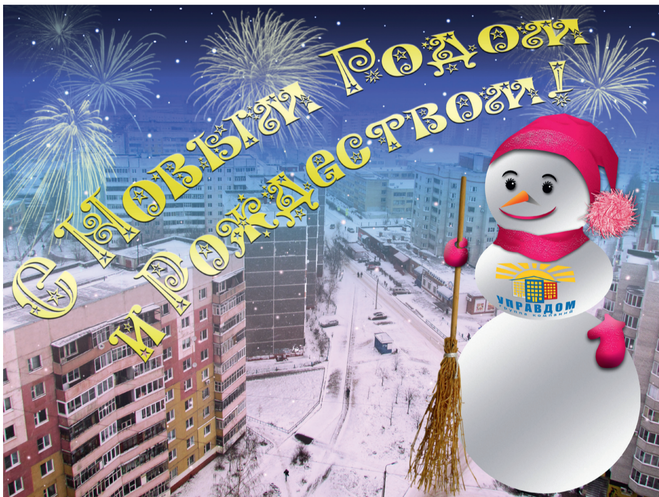
Коллаж Анны Баскаковой.