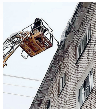
Идет очистка кровель и зимняя уборка дворов района от снега и льда.