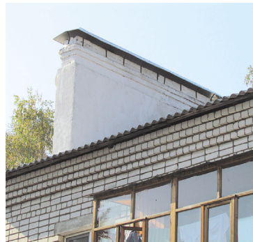
Качественный ремонт крыши в Толге.