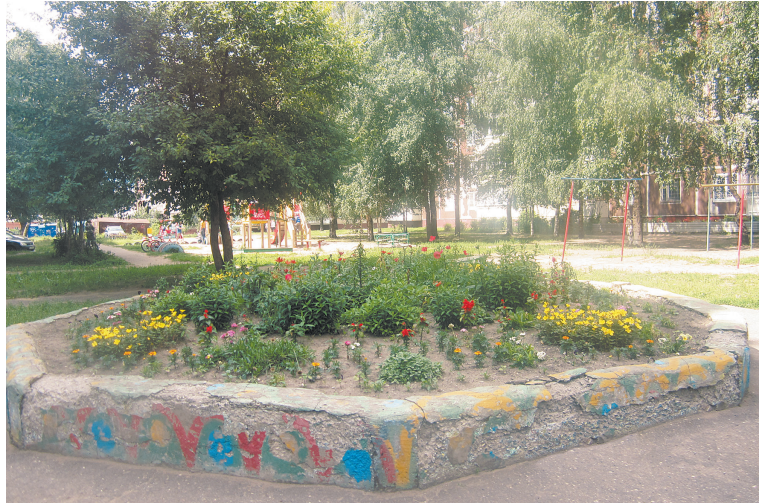
Большая клумба на Яковлевской, 18.

Ряду участников конкурса «Цветочная фантазия» от имени