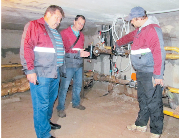
Работники первого производственного участка Управдома Заволжского района готовы к сезону промывки и гидравлических испытаний систем теплоснабжения в многоквартирных домах.

Кроме того, слесари-сантехники Управдома в соответствии с нормами эксплуатации оборудования проводят прочистку лежачих и