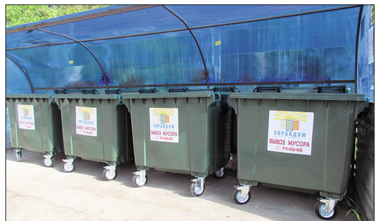
Так теперь выглядят многие контейнерные площадки, которые обслуживает Управдом Заволжского района.