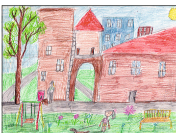
Рисунок Насти Соловьевой