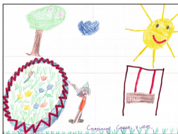
Рисунок Саши Скоросова