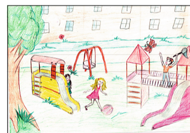
Рисунок Алисы Баскаковой