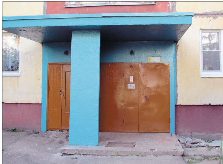
Обновленная входная группа.

формы во дворах, закрашивают граффити, обеспечивают покраску тех подъездов, где управляющая компания ведет плановые ре-