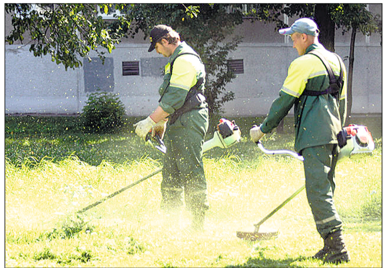
Окос травяного покрова во дворах.

Окос травы на газонах и придомовых территориях Управдом