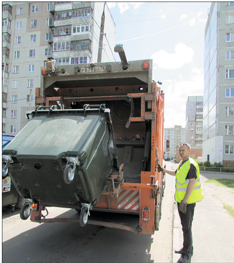
Новая техника в работе на улице Саукова.

Ответственность за санитарное состояние мест сбора ТБО несут как мастера по территориям, так и дворники вместе с рабочими