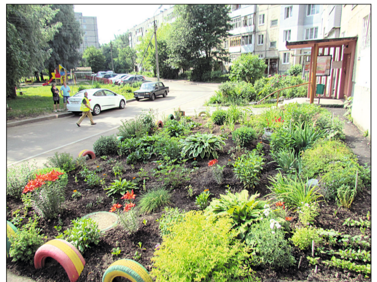
Клумба на ул. Красноборская, 21.

Неравнодушные жители Заволжского района по зову сердца украшают территории возле своих домов.