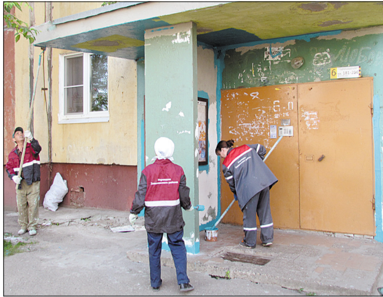
Бригада маляров Управдома Заволжского района за работой.

Хозяева дома и прохожие сразу обратили внимание на результаты работы – свежее выкрашенные двери, козырьки и стены приятно гармонируют теперь не только со стенами названной девятиэтажки, но и с внешним видом соседнего здания современной постройки. Перед тем как привести каждый вход в порядок, штукатур-маляры тщательно очистили поверхность от приклеенных к ним бумажных объявлений. Стены выровняли, чтобы затем валиком и кистями аккурат-