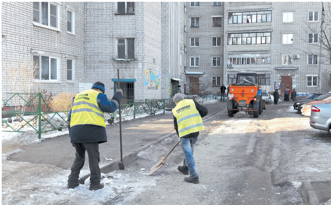
Механизированная посыпка речным песком и ручная уборка двора многоквартирного дома на проспекте Авиаторов, 90.