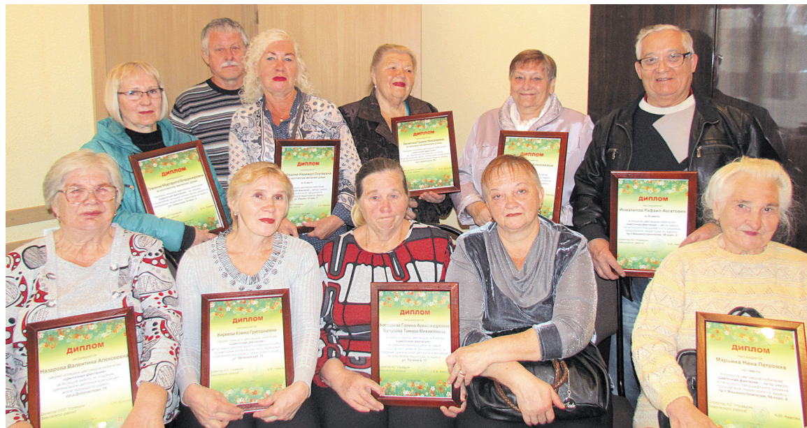
Победители и призеры конкурса цветоводов Управдома Заволжского района.