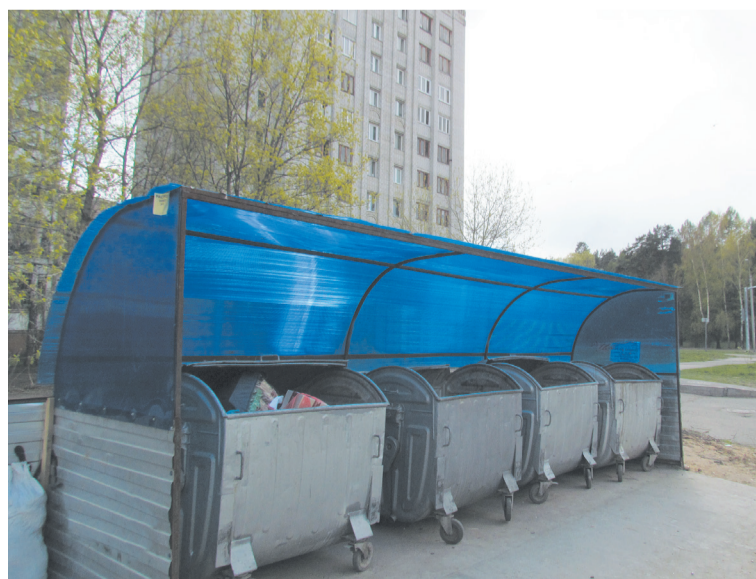
Так на территории Управдома Заволжского района оборудованы контейнеры для мусора.