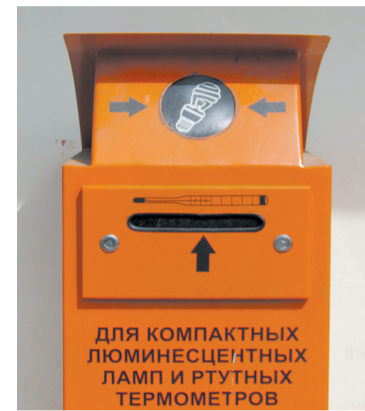
Отработавшие свой срок бытовые приборы с ртутью лучше утилизировать в таких надежных контейнерах.

Заволжский Управдом одним из первых в городе поставил заслоны отраве.