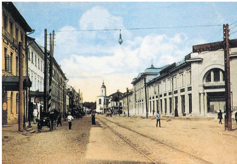
Большая линия – ныне ул. Комсомольская.