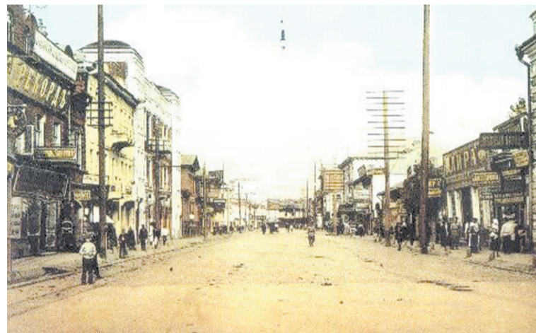
Власьевская улица – ныне ул. Свободы.

Конечно, иные домовладельцы обходились «своими силами»: как правило, в домах, где число квартир было меньше пяти, дворников не нанимали. А вот в доходных домах на Вла-