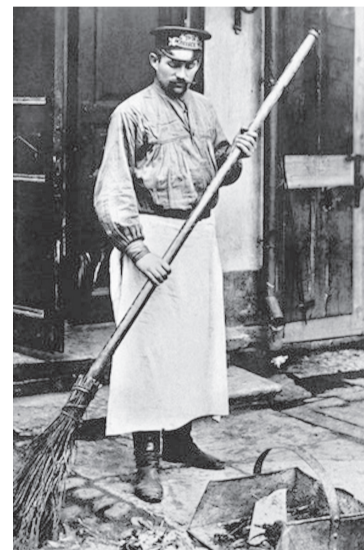
Дворник. 1905 год.

сьевской (нынешняя улица Свободы) или Рождественской (Б. Октябрьская) хозяева держали целый штат дворников, среди которых существовала четкая иерархия. Профессии дворника власти уделяли огромное внимание. Для того чтобы получить эту работу, человеку требовалось предоставить рекомендацию от уважаемых людей города. Все городские дворники подчинялись Министерству вну-