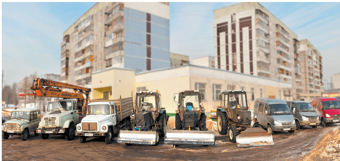
Управдом Заволжского района обладает мощной линейкой техники.