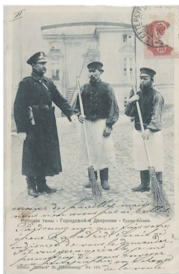
Городовой и дворники – открытка из серии «Русские типы».