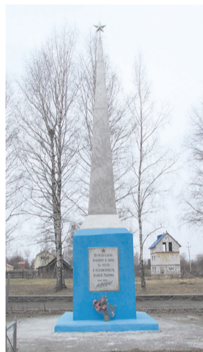
Обновленная стела на 3-й Сергейцевской улице

вой. Доброе дело, выполненное перед юбилеем Победы представителями Управдома Заволжского района, – это дань памяти и уважения тем героическим представителям их семей, которые внесли свою лепту в то, что 9 Мая стало священным днем для граждан нашей страны.