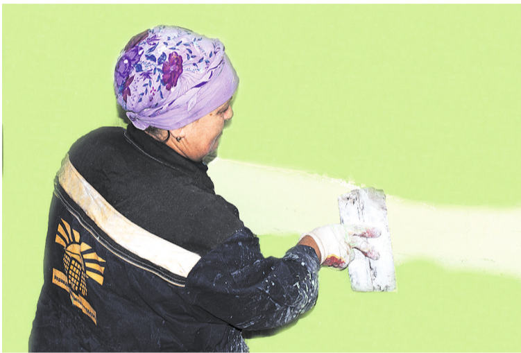
После ремонта стена будет радовать глаз

Ровно семьдесят лет отделяют нас от первого Дня Победы в Великой Отечественной войне. Четыре года шли кровопролитные бои не на жизнь, а на смерть ради того, чтобы над нашими головами было мирное небо. Те, кто вынес на своих плечах тяготы войны на фронте и в тылу, кто решительно бил врага и самоотверженно обеспечивал бойцов переднего края всем необходимым, и сегодня наши современники.