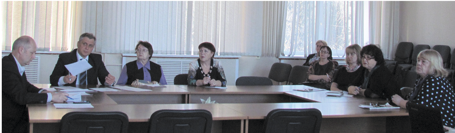
На заседании общественного совета Заволжского района

Подготовка к празднованию 9 Мая и расшивка «узких мест» – таков диапазон тем, которые обсудили на весеннем заседании общественного совета Заволжского района.