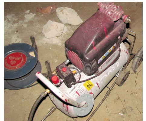
Оборудование для промывки трубопроводов

испытаний давление в системе повышается до величины, значительно превышающей рабочее давление, чтобы выявить потенциально возможные места образования дефектов. Подготовка к отопительному сезону считается успешной в части гидравлических испытаний оборудования и трубопроводов, если во время их проведения и при осмотре не обнаруживается протечки воды и разрывов металла. По результатам испытаний проводятся необходимые ремонтные работы и замена оборудования. Специалисты по мере необходимости заменяют арматуру, ремонтируют оборудование, проверяют состояние теплоизоляции на трубопроводах и элеваторных узлах, устанавливают прошедшие поверку термометры и манометры.