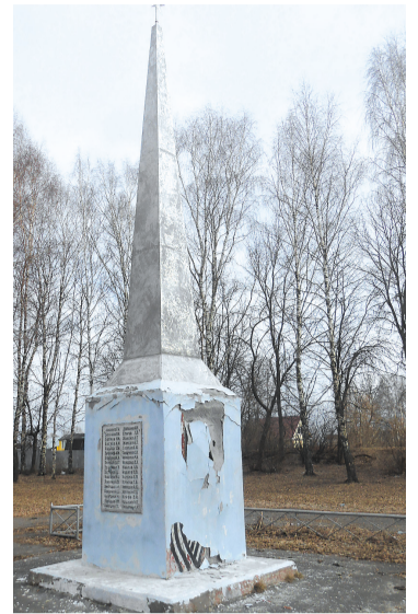
Время не пощадило памятник