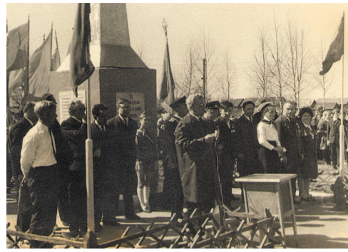
Так открывали монумент в конце 60-х годов прошлого века