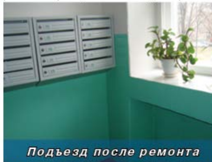
Подъезд после ремонта

Преимущества этой системы поняли уже многие собственники. В 2011-2012 годах жители 28 домов нашего района приняли решение проводить в своем доме ремонт