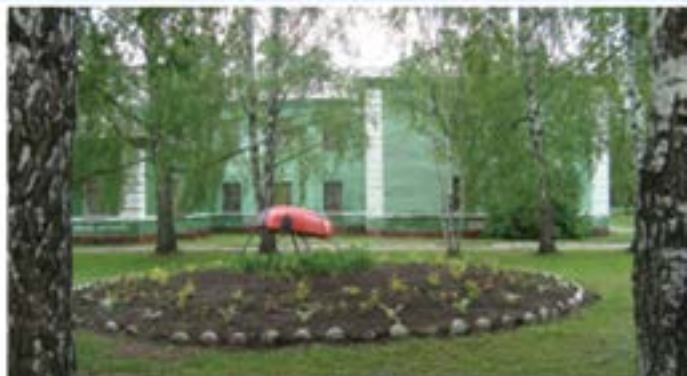
Клумбы от «Управдома»

Управдом Заволжского района – это открытая компания, которая стремится к продуктивному сотрудничеству и совместной с жителями работе на благо вверенного ей района. Это первый помощник для всех, кто хочет сделать свой дом, свой двор, свою улицу уютными, красивыми, чистыми!