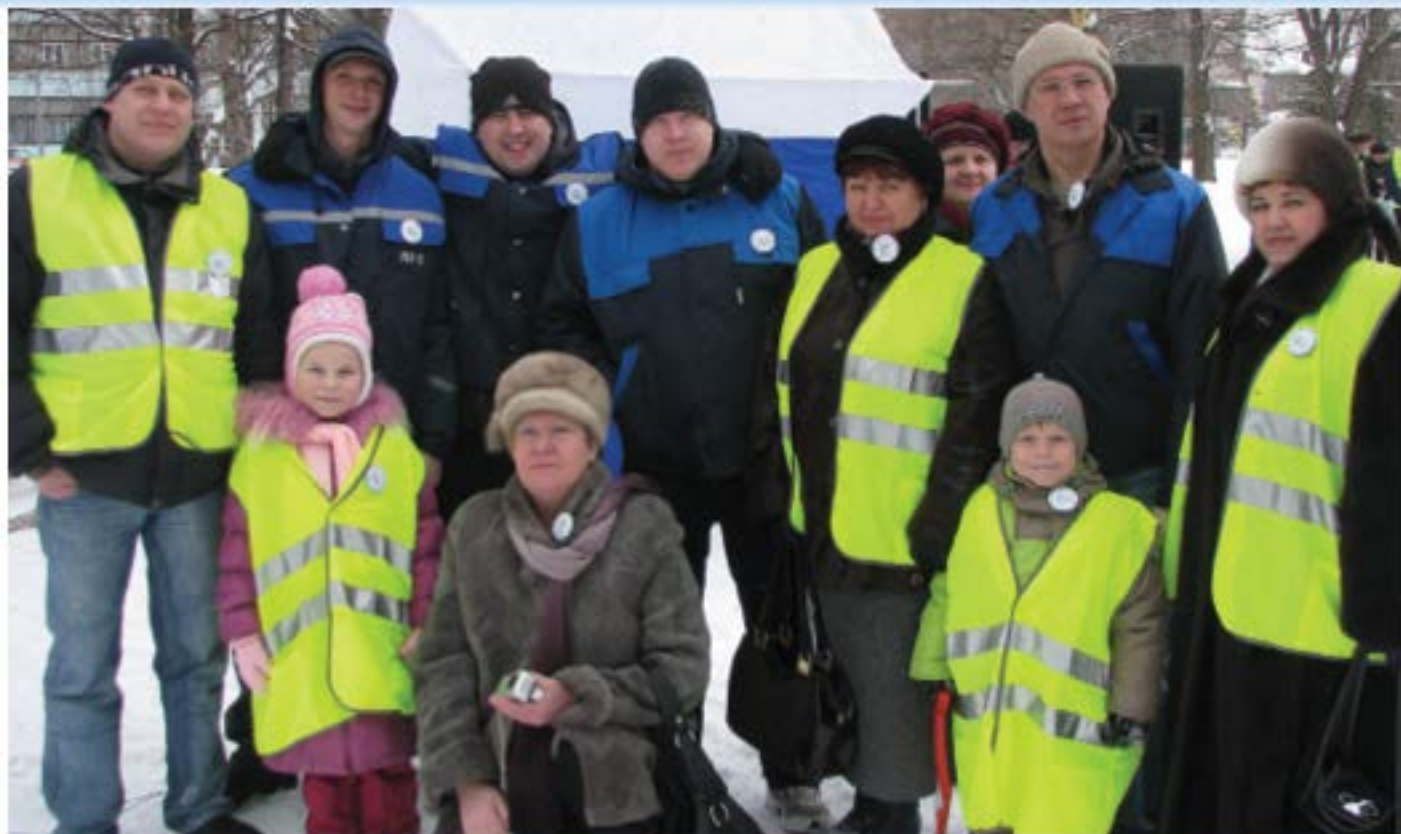
Команда «Управдома» на городской Масленице