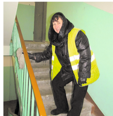
Так работают мобильные клининговые бригады Управдома Заволжского района.

подрядчиками. К сожалению, многие из них не всегда умеют разговаривать с владельцами жилья, не знаящими строительных тонкостей, на понятном обоим сторонам языке.